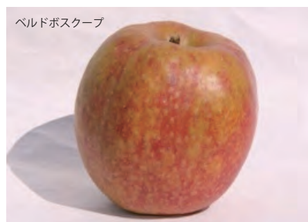
ペルドボススクープ