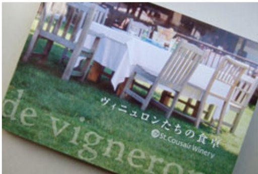
サンクゼールのブランドブック