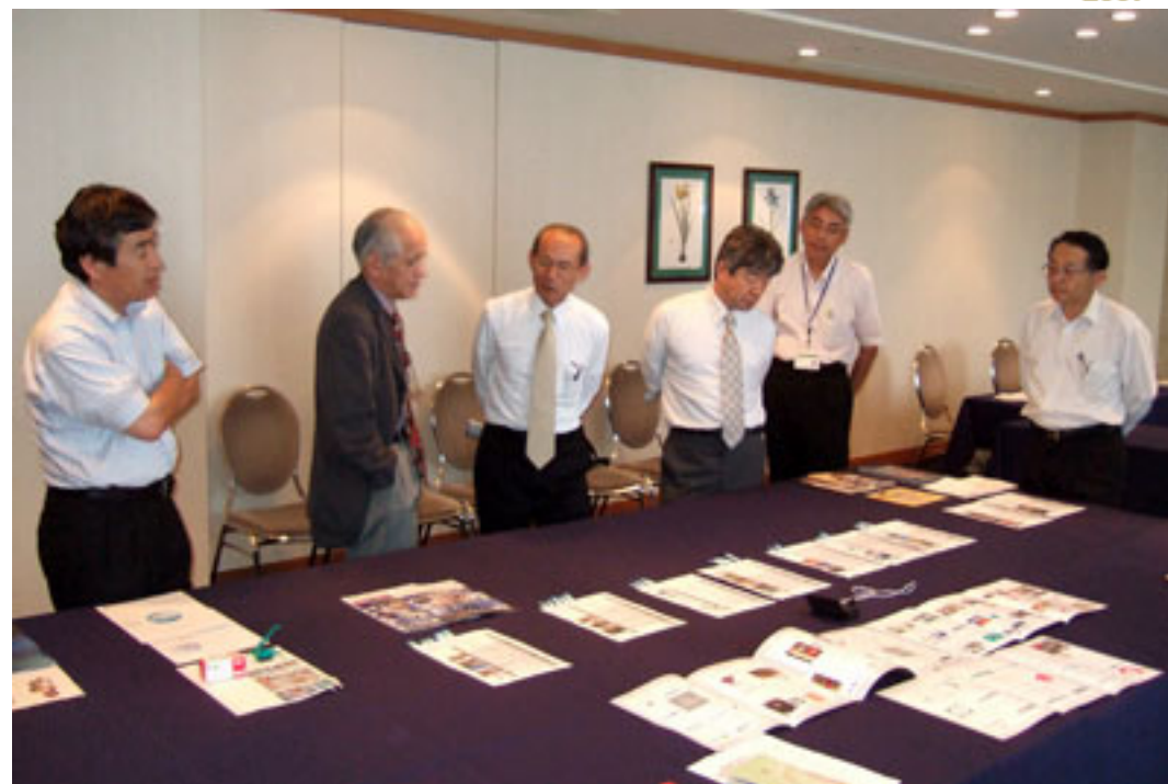
( 07年9月13日(木) 長野市にて開催した選考会の様子 )

今春から約半年掛けて推薦と一般公募による選考作業を進め、本年は10のブランドをノミネートしました。9月に最終選考を行った結果、それらノミネートブランドが入選となり、その中から大賞1、特別賞4が選定されました。